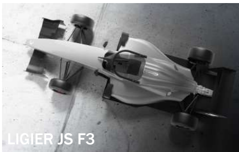
LIGIER JS F3