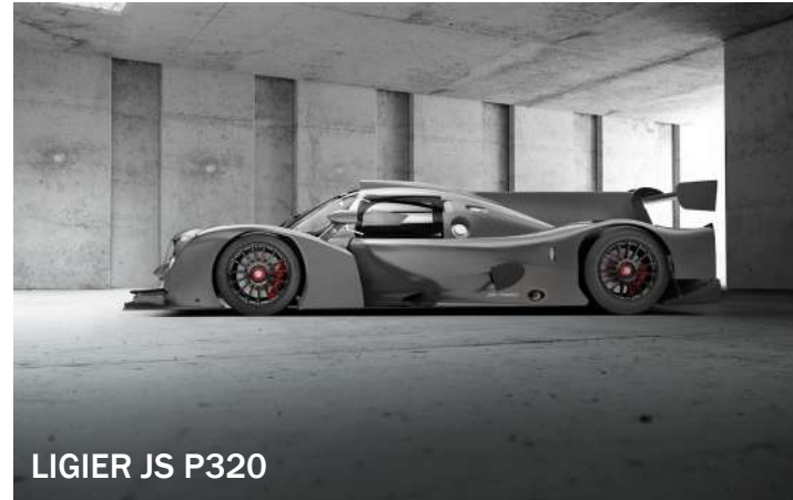
LIGIER JS P320