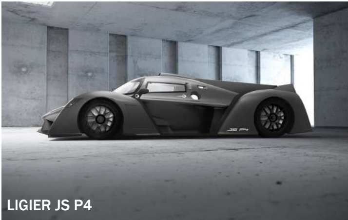
LIGIER JS P4