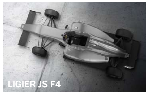
LIGIER JS F4