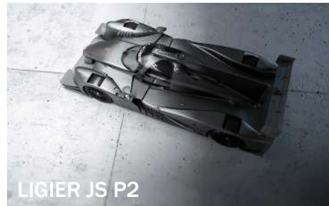
LIGIER JS P2