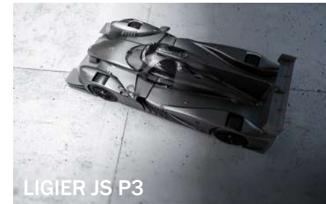
LIGIER JS P3