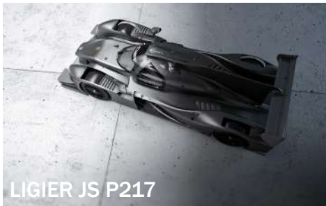
LIGIER JS P217