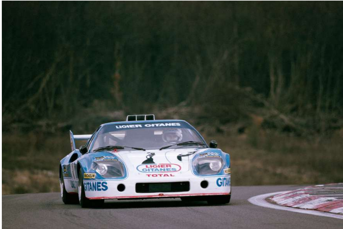
Ligier JS2 - 1975